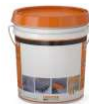
EMBALAGEM Balde com 18 kg

*"Produtos não enquadrados na Resolução em vigor sobre transporte de produtos perigosos"